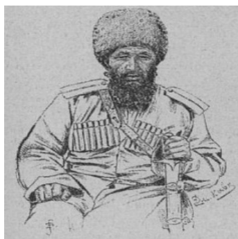
Рис. 4. Мурат-хан. Рисунок Л.Е. Дмитриева-Кавказского. Fig. 4. Murat Khan. Drawing by L.E. Dmitriev-Kavkazsky.

Oasis, 1883: 89). Мурат-хан был запечатлен художником Л.Е. Дмитриевым-Кавказским в его записках «По Средней Азии» (Дмитриев-Кавказский, 1894: 4) (рис. 4).