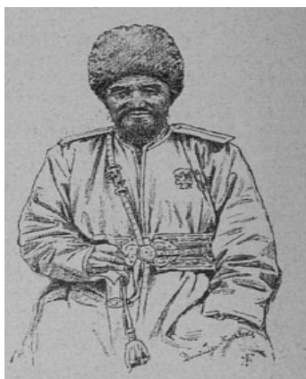
Рис. 2. Сары-Батыр-хан. Рисунок Л.Е. Дмитриева-Кавказского. Fig. 2. Sary-Batyr Khan. Drawing by L.E. Dmitriev-Kavkazsky.

Художник Л.Е. Дмитриев-Кавказский в своих записках «По Средней Азии», сделал ряд интересных зарисовок. На одной из них запечатлен безымянный текинский хан, удивительно похожий на Сары-Батыр-хана (Дмитриев-Кавказский, 1894: 1) (рис. 2).