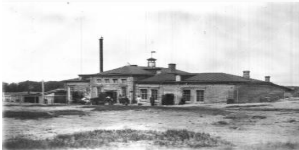
Сурет 1. Ауыл шаруашылығы мектебінің ғимараты, Семей, 1920ж. (ҚР МАМ ОМКФДЖА, 8-2484)

Қарастырылып отырған жылдың соңына Семей губерниясында 4 шаруа жастары мектебі қызмет етті, оның ішінде тек біреуінің қазақ жастарына арналуы қазақ ауылындағы білім беру жүйесіндегі қиындықтарды аңғартады. Дегенмен, шаруа жастарына арналған мектептерге деген сұраныс ұзақ уақытқа созылған жоқ, олар ауыл шаруашылығын ұжымдастыру кезеңінде шаруа мектептеріне айналып, 1930 жылдардың ортасына дейін қызмет етті (Керейбаев, 1989:31).